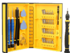
GA163 KIT DE FERRAMENTAS PARA GABINETES